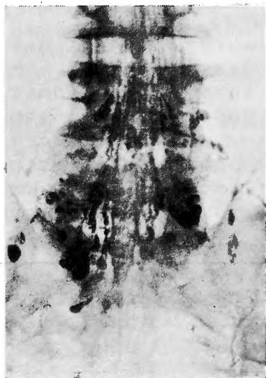
ミエログラフィー後45日目 (椎管外溢出生著明)