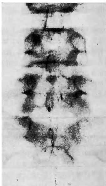
ミエログラフィー後2ヵ月 (myelopaqueの陰影消失)