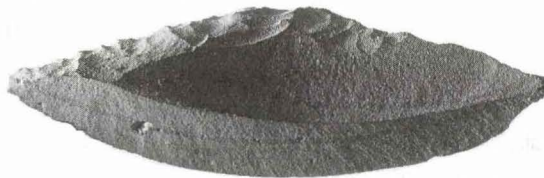
2万年前に作られたナイフ形石器