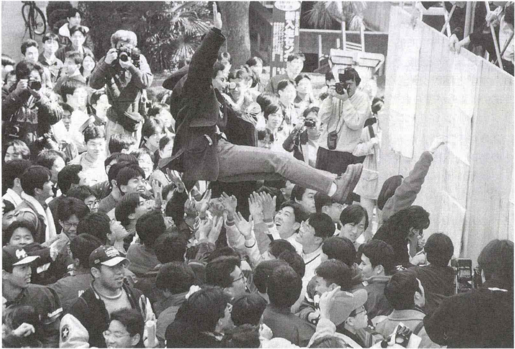
前期日程試験合格者発表（3月9日工学部にて）