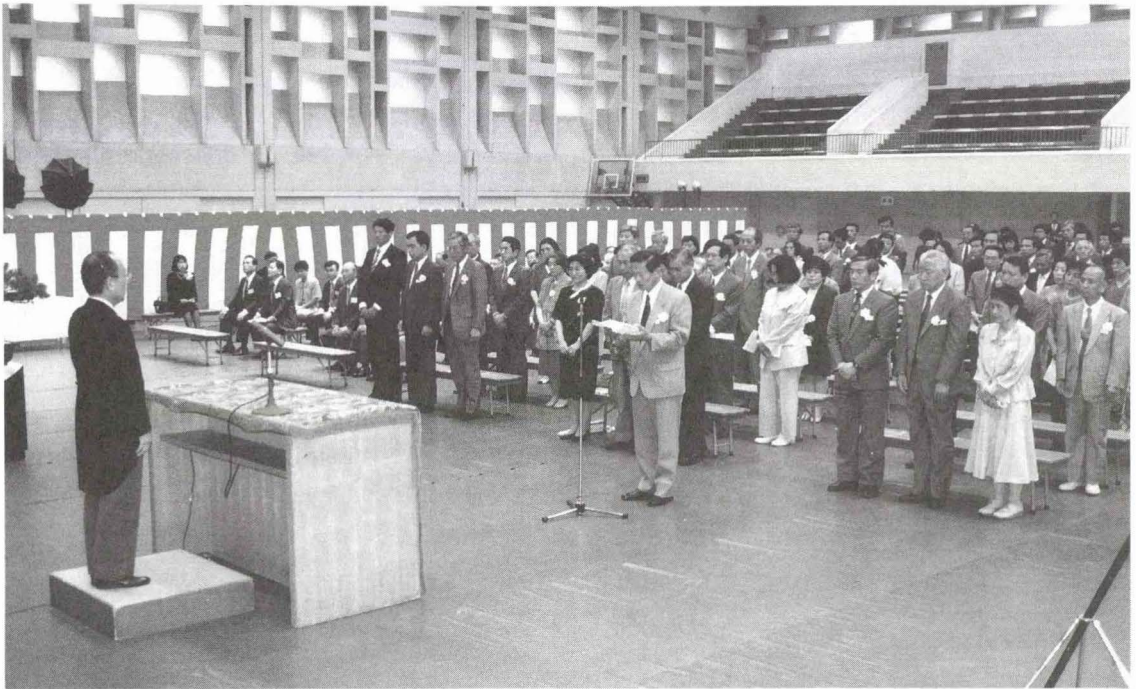
創立97周年記念式典 ー関連記事本文811ページー