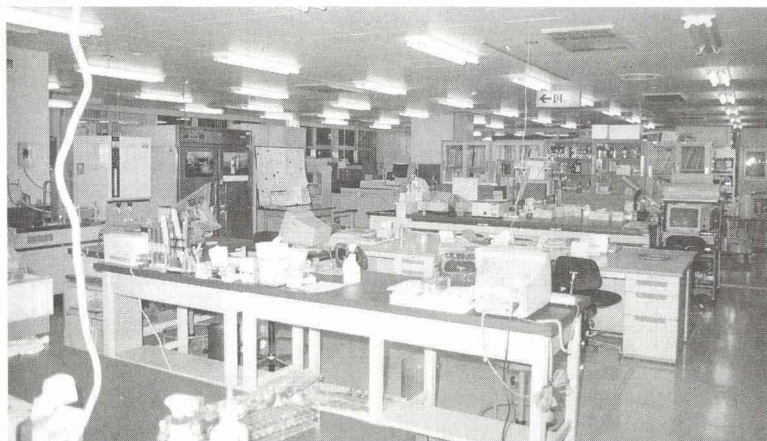
写真2 検体検査部門