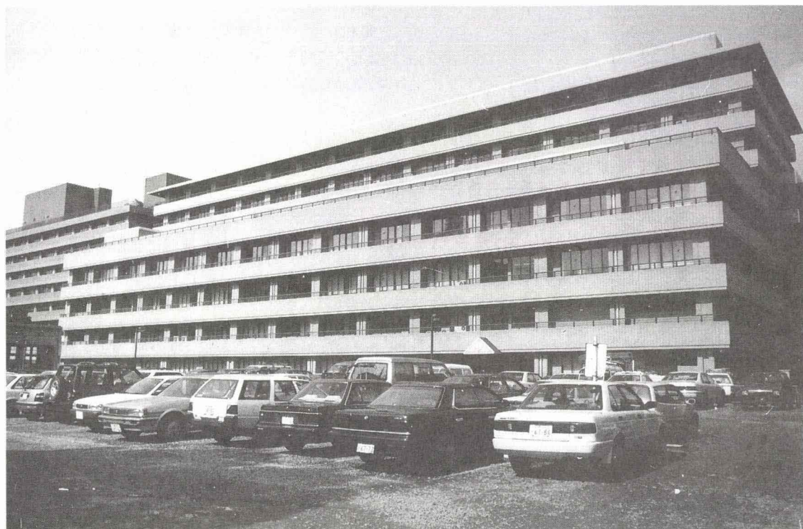
医学部附属病院中央診療施設棟・医学部第二臨床研究棟