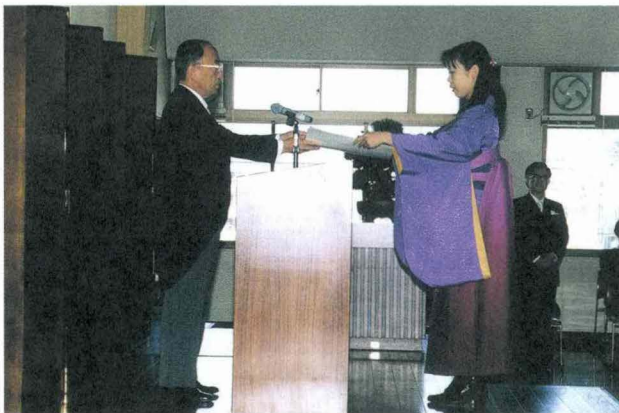
平成8年度医療技術短期大学部卒業式・修了式