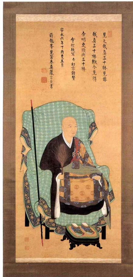
真嚴宗乗像 原在中筆 自賛

大徳寺第390世。項相は室町時代以降盛んに作られたが、本図もその伝統にのった格調高い作品である。