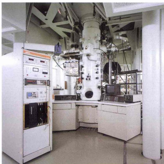
同顕微鏡下部（高分解能観察装置）