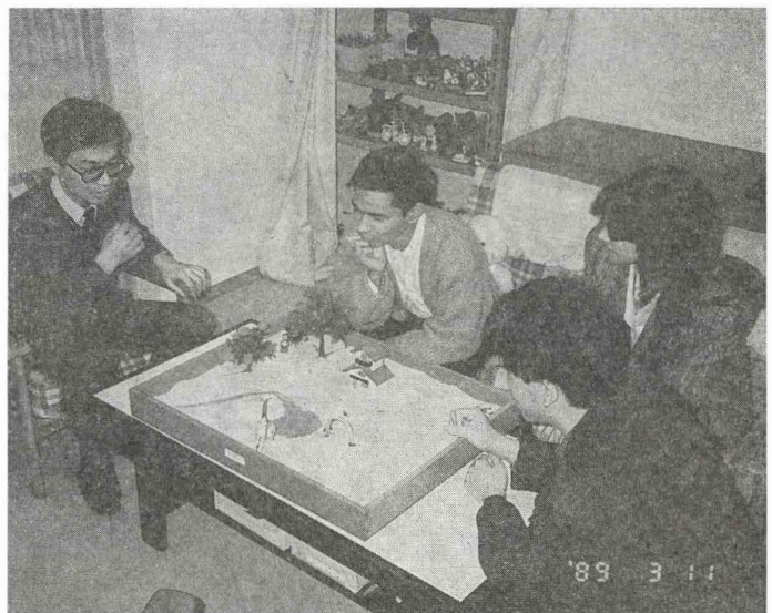
心理療法実習での討論風景

しかし、臨床心理学に関していえば、何らかの困難や問題をもつ子どもとの現実の相談活動においては、子どもはカウンセラーの存在自体によって影響を受けざるをえない。このため、臨床心理学は子どもの経験している生活世界と教育的状況について常に多面的・総合的に考慮する必要があり、特に子どもを周囲の成人たちとの関係におい