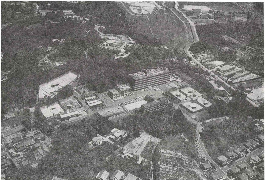
霊長類研究所の全景（愛知県犬山市）