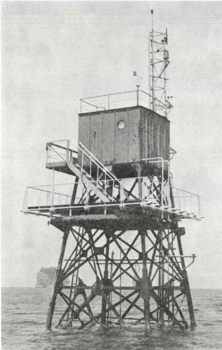
防災研究所・白浜海象観測所の海洋観測塔 ー関連記事本文18ページー