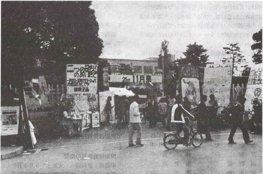
11月22日から26日にかけての11月祭では、ことしも各キャンパスで多彩な催しが繰りひろげられた。