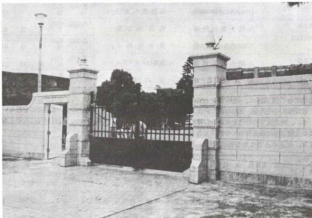
修復なった本部正門

さる7月20日から行なわれていた本部正門の修復工事が9月10日完了した。この正門は、旧第三高等中学校表門として明治26年に造立され、明治30年本学創設と共にその正門として引き継がれたもので、本学の歴史と由緒を伝える貴重な遺構である。