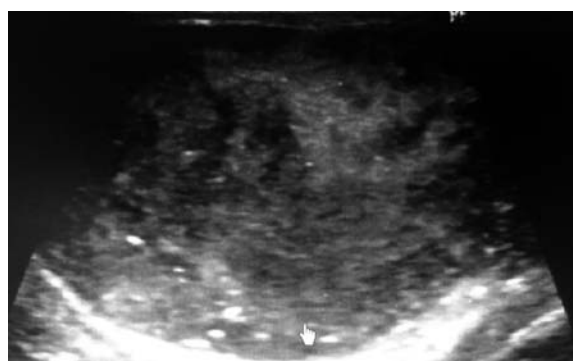
Fig. 1. Scrotal ultrasonography of the right testis revealed heterogeneous hypoechoic masses in both testes.

画像所見 : 超音波検査上右精巣は長径 67 mm と腫大しており, 内部は全体的に不均一であった。左精巣は長径 35 mm, 内部は右精巣同様に全体的に不均一