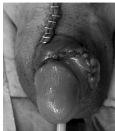
Fig. 4. Photograph of the penis after the operation.