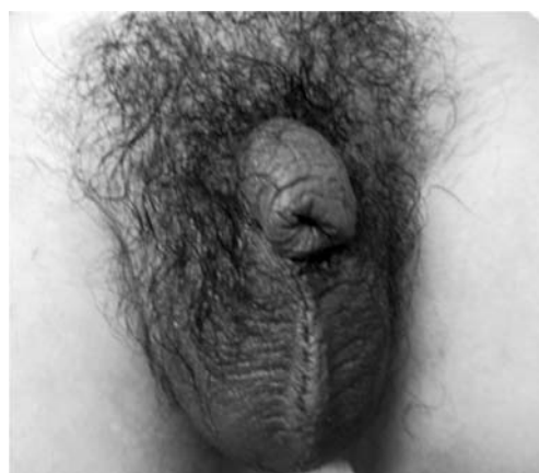
Fig. 1. Photograph of the penis.

初診時現症 : 身長 161 cm, 体重 62.2 kg, JCSI-3, 体温 37.2°C, 血圧 101/71 mmHg, 脈拍74回/分。下腹部の痛みを認め陰部および陰嚢は腫大していた。また外尿道口を確認できず, 筒状の陰茎包皮を認めるのみであった (Fig. 1)。両側精巣は陰嚢内に触知し,