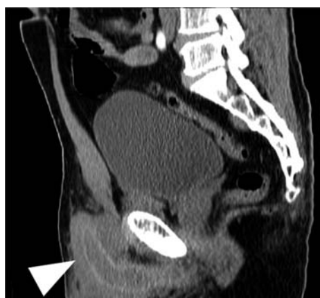
Fig. 2. Computed tomography showing the penis. The arrow shows the penile.

本症はきわめて稀な疾患であり、われわれが文献的に検索しえた限りでは1946年に Curr 1) が報告して以