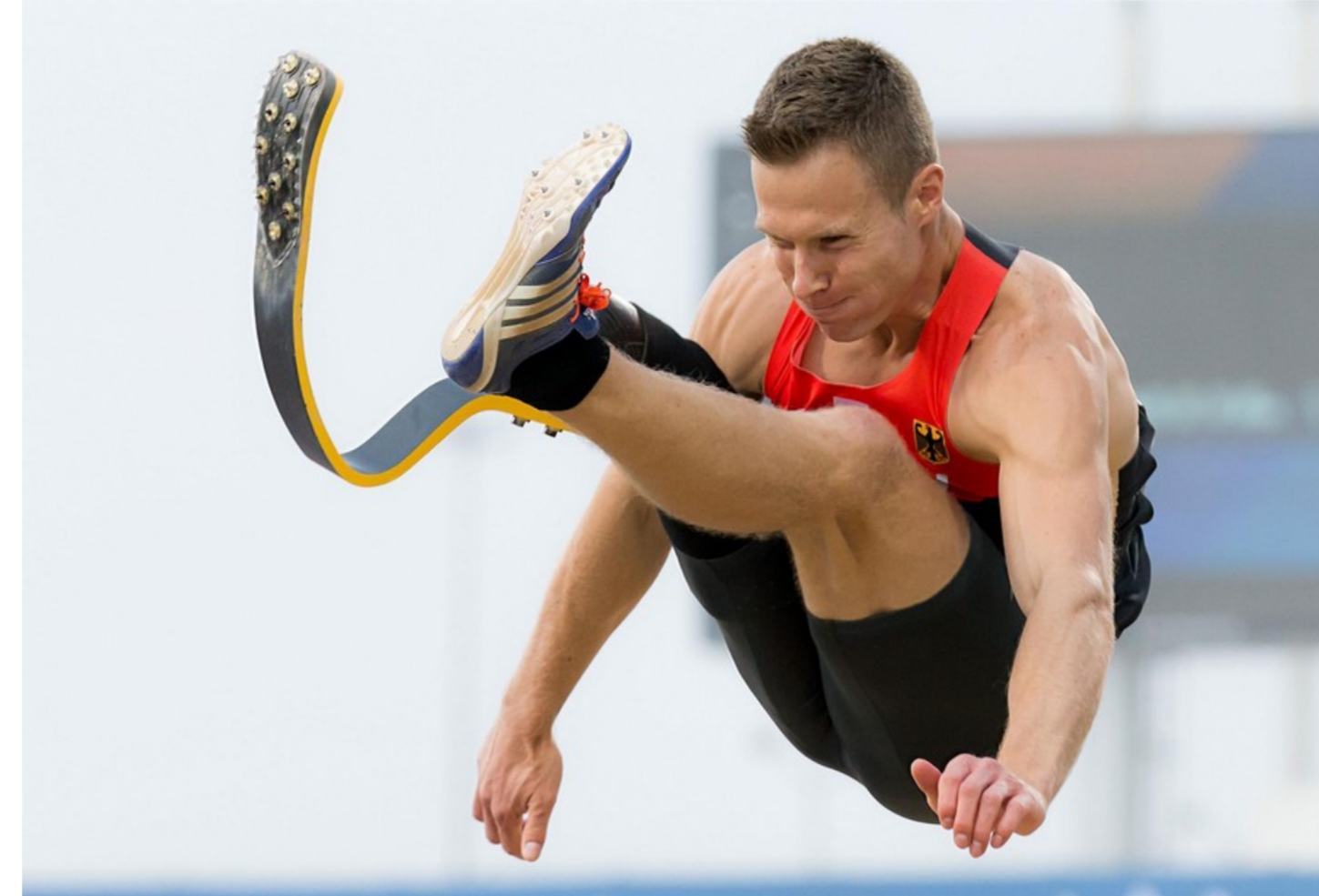
マイケル・レーム 2015年パラ陸上世界選手権