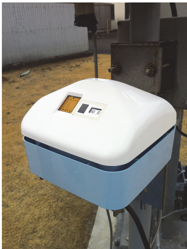
図2：WNI 地上観測器「ソラテナ」外観。

また、地球観測衛星や気象レーダーといった、従来から使われている観測システムについても、機能を特化させることで不要な冗長化を無くしたり、部品や製品として民生品を用いることで、比較的