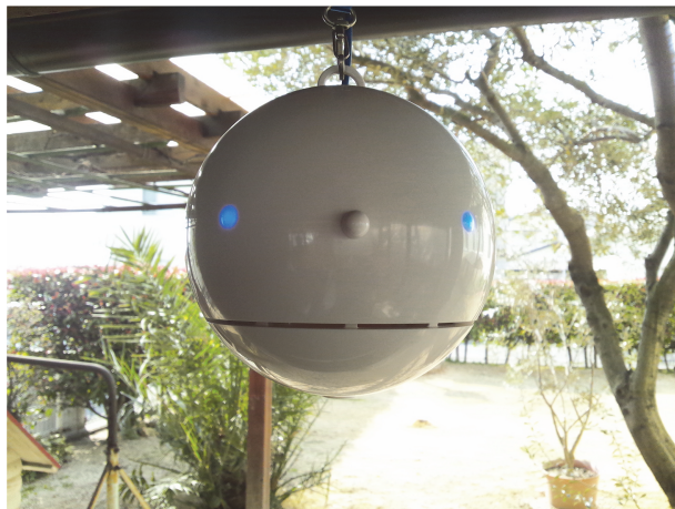
図 1: WNI 花粉観測器「ポールンロボ」外観。

2011 年からは、KDDI 株式会社と共同で地上観測装置「ソラテナ」(図 2、引用 4) を携帯基地局を中心に約 3000 ヶ所設置して運用している。これは、気象要素である気圧・気温・湿度だけでなく紫外線量や日射量も観測することで、地上観測の高度化及びそれを生かしたコンテンツの高度化に