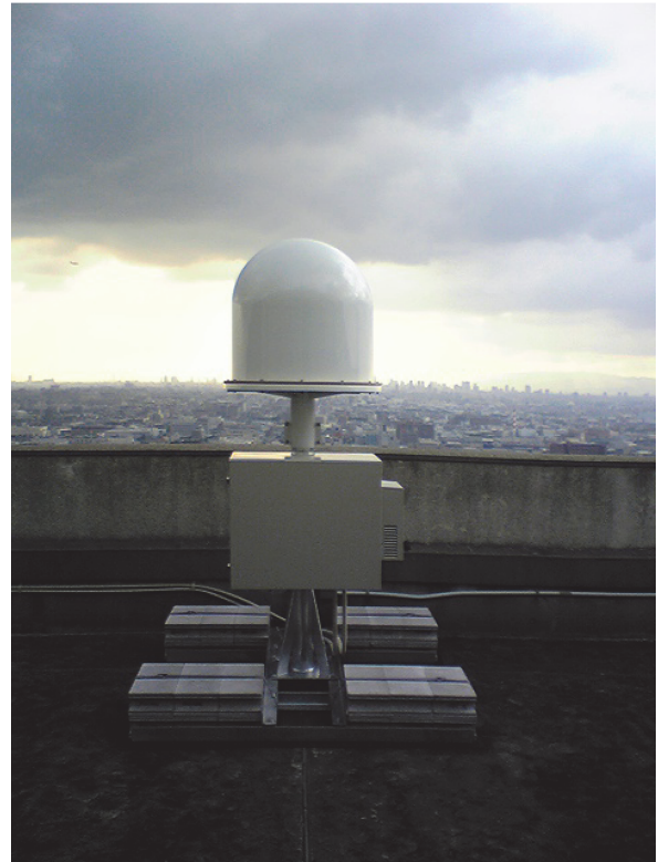
図5：WNI 気象レーダー「WITH レーダー」。

気象レーダーについては、既存の気象レーダーは大型で広範囲（数百 km レンジ）をカバーするように設計されているが、カバーできる水平範囲は広いものの地球の曲率を考えると、レーダーから離れた場所ではレーダービームが地表から離れていき、地表付近を観測することが困難となる。また、積乱雲に伴う強雨や顕著現象の代表例である竜巻といった現象は地表付近で起こるため、気象学的にも地表付近の観測を密にすることが求められている。そこで、既存の大型気象レーダーではカバーしにくい地表付近のデータを取得し、またレーダーの設置や移動がしやすいような気象レーダーとして、「WITH レーダー」を開発した（図5、引用8）。WITH レーダーは、航空機の先端に搭載されている、これから飛行する先の気象状況を把握するための航空機搭載型気象レーダーをベースとし、さらに必要な機能、レーダー制御、設置・回転を可能とする台座やレーダーを覆うためのレドーム、受信信号を解析しレーダー反射強度やドップラー速度といったレーダーパラメータを計算するための信号処理装置、インターネット回線に接続するための周辺機器などを自社開発して、2016年現在、日本全国80か所に展開している。航空機搭載型気象レーダーは、元々レーダーから近い場所を観測し、航空機に搭載するために小型・軽量、且つ高い技術基準で設計・生産されており、また地上設置型の気象レーダーよりも生産台数が多いため、航空機外である地上で運用してもレーダーの故障率が低く、併せて初期費用が従来型よりも1/10程度に抑えることが可能となった。現在日本国内では実験試験局として運用しており、これらを実用局化するべく米国オクラホマ大学と協同し新しい気象レーダーを開発中である。気象レーダーに関しては、「WITH レーダー」のような小型のレーダーばかりではなく、XRAIN（引用9）のような大型且つ観測パラメータを増やしたレーダーや、フェーズドアレイレーダーのように、レーダービームを電子的に制