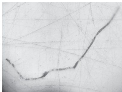
図 3. 上記のよく成長したクラゲが退化して走根を形成し不完全に若返る (2016 年 6 月 18 日撮影)