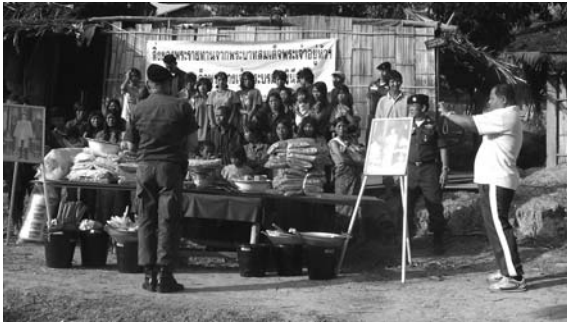
写真 3 BPP 隊員による写真撮影 (2013 年 5 月 3 日)

も一応の益とはなったが、しかし BPP 隊員らにとっては救援物資の提供よりも報告書作成のための写真撮影の方が重要であり、優先される。