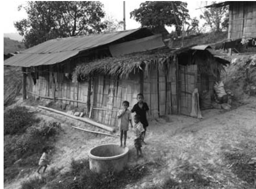
写真2 ムラブリの家 (2015年3月8日筆者撮影)

柱に竹を縦に裂いて広げ外壁として張り付けただけの極めて質素なものである (写真2)。さらにモンでは101世帯中41世帯がピックアップトラックを持ち、その内の一部は換金作物栽培に不可欠な機材等を持っているが、ムラブリでは海外からの支援で提供された4tトラック1台以外、125ccのバイクを各世帯が少なくとも1台所有しているに過ぎない。