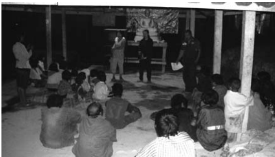
写真4 会議Aの様子（2013年12月13日）

先に挙げた事例に見た二つの会議は異なる時間と場所で開かれたものだが、ムラブリの態度に目を向けると、そこには極めて多くの共通点が認められる。とくに際立っているのは、ムラブリの消極的ないし受動的な態度である。例えば事例1（以下、会議A）ではテレビの前に座っていた子供とは対照的に、大人たちは集会場を囲むように集まり、決して集会場のなかに自ら入ろうとはしなかった（写真4）。また事例2（以下、会議B）では、集会場に並べられた椅子のなかでも後ろの方に座ったり、集会場の壁伝いに座ったりと、前や中央に陣取るモンとは対照的に、できるだけ目立たないところにムラブリたちは陣取っていた。加えて会議Aで唯一反論した若者が実はすでに酒を飲んでいて気が大きくなっていたこと、また会議Bに見たタ・シーの発言はその場を取り仕切る郡庁職員からの要求が発端であったことから、やや間接的ではあるが、ムラブリの多くは会議に積極的に参加しようとはしていなかったことが窺える。 18) こうした消極的とも受動的とも言える彼らの態度が、既に触れたよそ者に対する恐怖心に拠るものであると考えることはあながち的外れではない。「よそ者が怖い」（ krɔw kwɔr ）