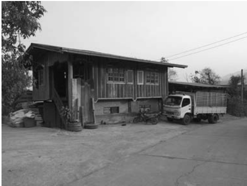
写真1 モンの家 (2015年3月8日)