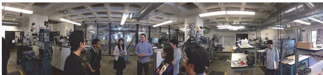
pic.6 Machine Shop