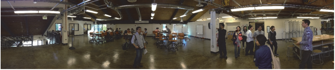
pic.2 Idea Forge Commons