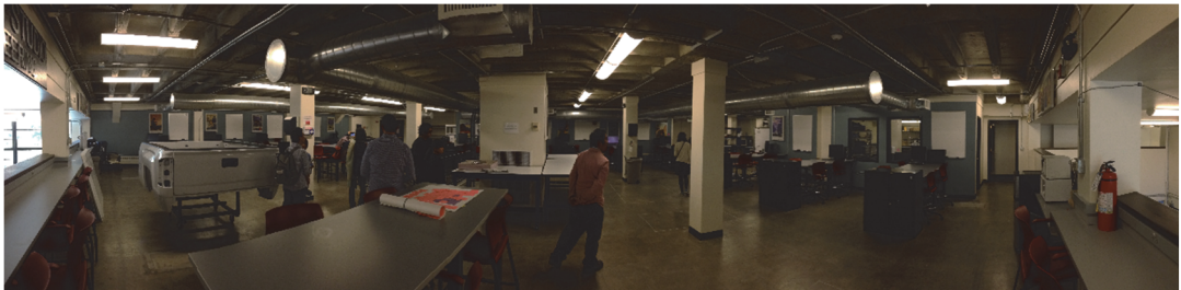
pic.7 Chevron Design Lab

1階に戻り、コモンズと入口を別にしたスペースに、“Drop In Design Lab”がある。ここは製作を行っている学生がドロップインで利用できるスペースである。制作用のオープンなスペースと別に、3D CAD用のデスクトップPCがあり、ツアー当時も数名の学生がモデリングを行っていた。また、長期的に製作中のものも置いておけるようで、コンピューターを開発している学生が広いスペースを使って活動を行っていた。このスペースの2階に“Chevron Design Studio” (pic.7) があり企業との共同プロジェクトなどに利用されていた。このスペースは簡易的な小型オフィス（会議室）的な様相で、長期的にアサインできる。プロジェクトの資料などが保管できる鍵付き小型のロッカーも設置されており、突発的な打ち合わせなどにも空間をセッティングするわずらわしさが解消されるように思う。その他にも“MESAB Teleconference Room”や“Think Tank”などミーティングに特化したスペースも設置されており、プロジェクトを推進する環境としては素晴らしい設備が整っている。