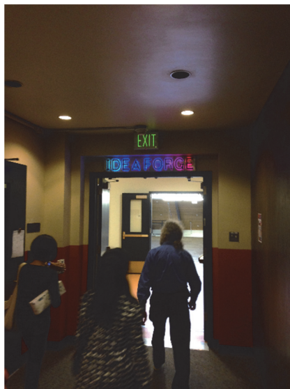
pic.1 アイデアフォージ