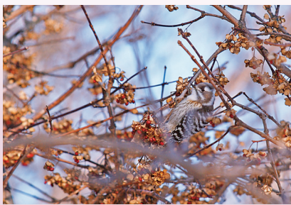
豊作だったマユミの実を食べにきたコゲラ（北海道研究林）