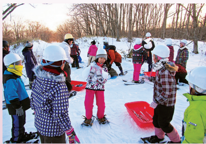
しべちゃアドベンチャースクール「冬の森たんけん」（北海道研究林）