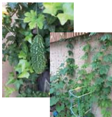
経営管理大学院 (自宅にて)