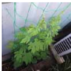
経済研究科/(自宅にて)