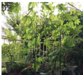
学際融合教育研究推進 センター/(自宅にて)