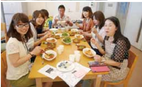
あるもんdeスパイスのススメ・・・「あるもん」をフル活用して食のあり方を考える『あるもんdeプラス』と、『京大カレー部』『でこべじカフェ』がコラボして、創作料理のWSを開催