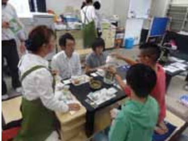
オープンラボにて、美味しいお茶を振舞うために、事前にプロからレクチャーを受け、マスター