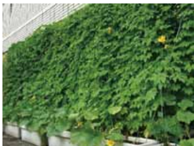
附属病院/(4年連続) (部屋の中から)

④ グリーンカーテンプロジェクトについては、エコ宣言WEBサイト( http://eco.kyoto-u.ac.jp/ )内の「ゴーヤブログ」でも詳しくご覧頂けます。本ページの写真は、学内外の里親の皆様からご提供頂いたものです。環境科学センターで種から育てたゴーヤを、希望者(里親)にお配りして、育てて頂くという取組。学内落ち葉で作った堆肥もあわせて、ご活用頂いております。平成28年度は自宅も含め里親59カ所のうち15カ所から写真をいただきました。なお、5年連続植えておられる所が3カ所ありました。