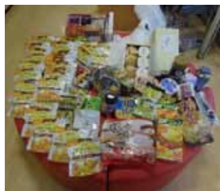
熊本の震災支援のフリマやフードドライブ(食品の寄付;右写真)も実施