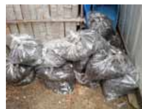
袋詰めした腐葉土