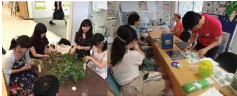
恒例のオープンラボ(ルネ)は、先生との直接対話やWSで好評