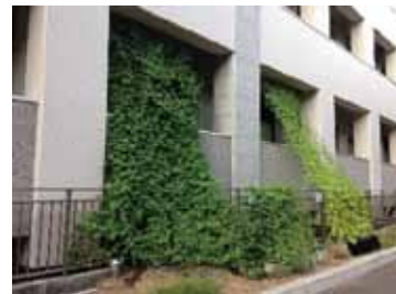
人間環境学研究科/(5年連続)