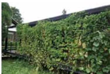
フィールド科学教育センター (今年初めて)