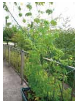
工学研究科桂地区 (今年初めて)