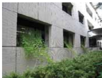
薬学研究科/(今年初めて)