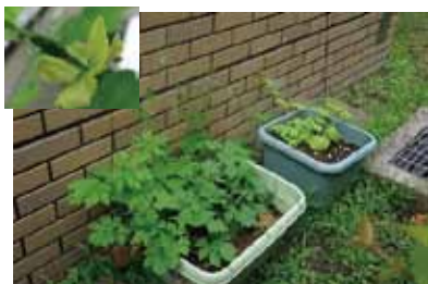
農学研究科/(5年連続)