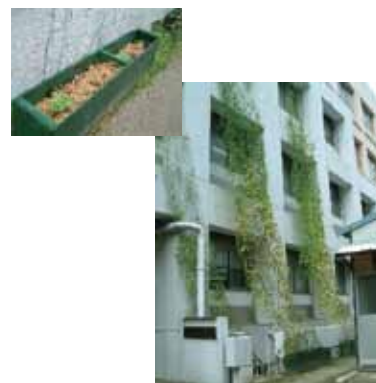
環境科学センター