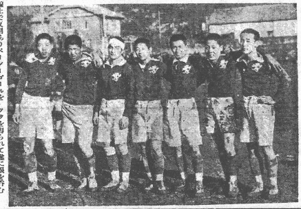
江崎工業大学のバスケマン