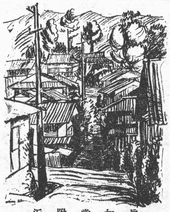
近附堂如眞 樹勝原前市醫學