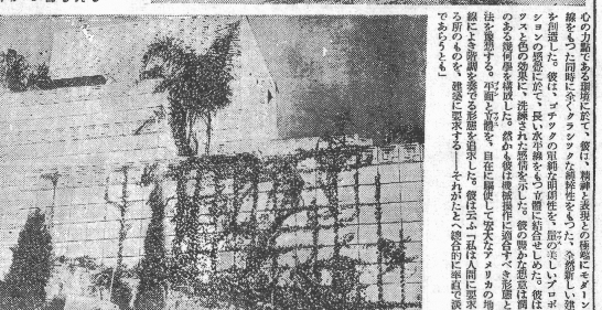
新しき形態美を求めて (2)

幾何學の歴史を、甘く仕上げた。幾何學の歴史を、甘く仕上げた。幾何學の歴史を、甘く仕上げた。