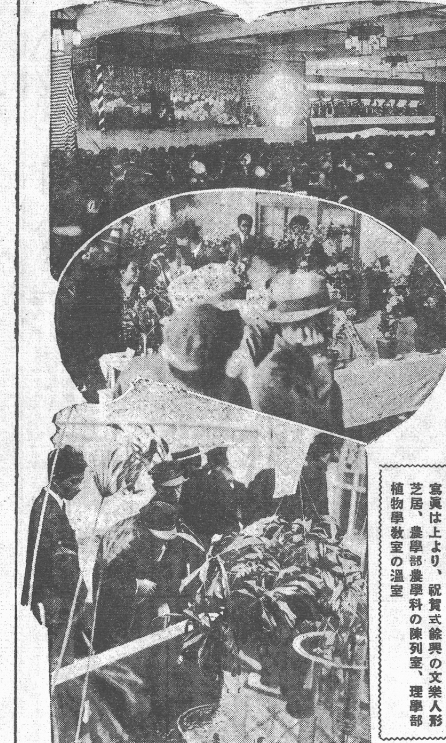
本學の教室から教室へと押寄せ、驚異の眼を睨るほどの賑ひを呈した。

院醫科齒山小 光正山小 本學の院醫科齒山小、光正山小が展示されている。市民二千餘人が、教室から教室へと押寄せ、驚異の眼を睨るほどの賑ひを呈した。