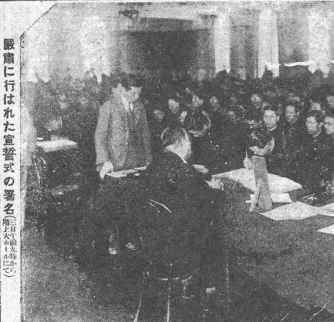
嚴肅に行はれた宣誓式(署名簿上は左から)

一思出話。この日は、文樂の人情や活動寫真も見える。また、園遊會の見合せも催される。