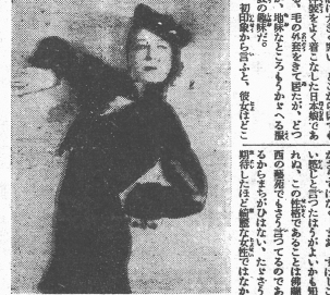
彼女がアゼチチの 小さい雛型である

「西班牙の舞姫」は、水田龍雄氏の力作である。この作品は、西班牙の舞姫の生活と愛を描き出している。作者の筆致は、繊細でありながら、力強い。この作品は、西班牙の舞姫の生活を描き出している。作者の創作力は、この作品を通じて、後世に受け継がれている。この作品は、西班牙の舞姫の代表作の一つとして、後世に評価されている。