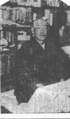
明かぬ裏に、一抹愛國の。明かぬ裏に、一抹愛國の。