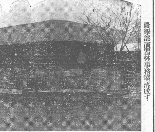
農學部演習林事務室落成式