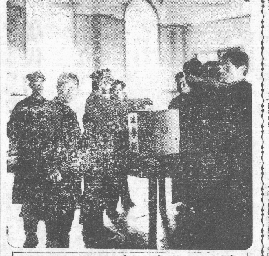
君一票に！ 代表議員選舉