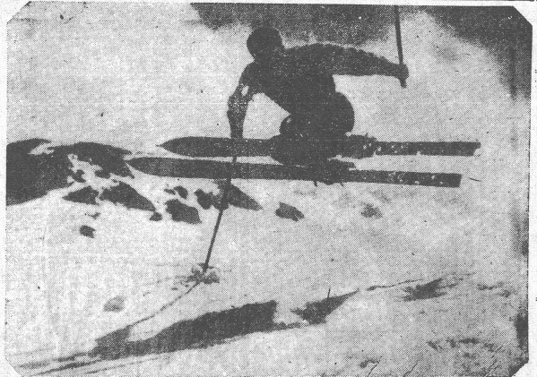
「組隊」練習「組隊」スキーヤーは躍る