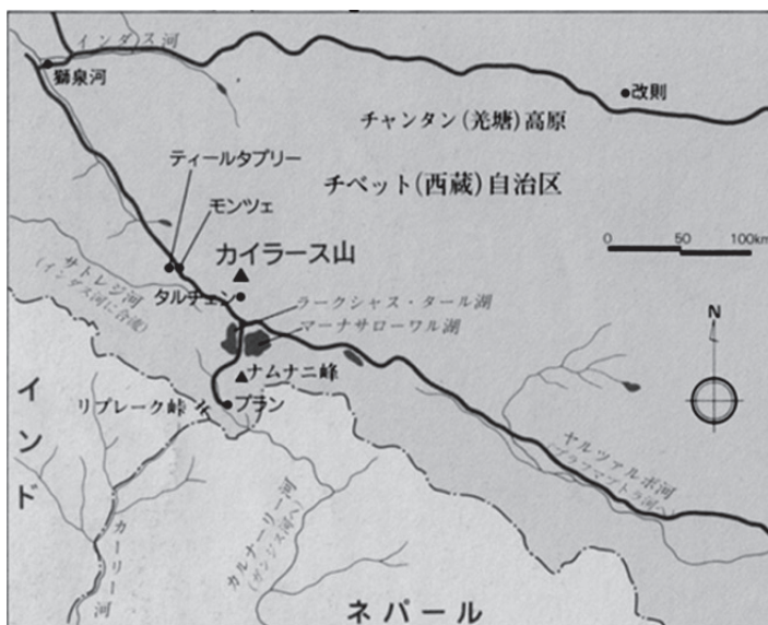
地図1 カイラス山とその周辺地域 (『季刊民族学』64号、p.101、1993)

いうチベットのことわざを紹介している聖地である。ヒンドゥー教徒はティールタブリー（巡礼の街）と呼び、現地で聞いた発音もそれが訛ったようなタータブリ、ディクタブリなどであったが、河口慧海は餓鬼の街（プレタブリー）とする。この場所は小高い丘の上に僧院が1つあり、それを中心に約1キロの環状の巡礼路がある。仏教僧パドマサンバヴァ（8世紀）がここを訪れて魔類を調伏したという伝承が残っていて、彼らが固まったとされる奇岩が点在する。ここは温泉地帯で、かなり広範囲に灰白色に変色した地面が剥き出しになっていて、不気味な雰囲気が漂う場所であった。