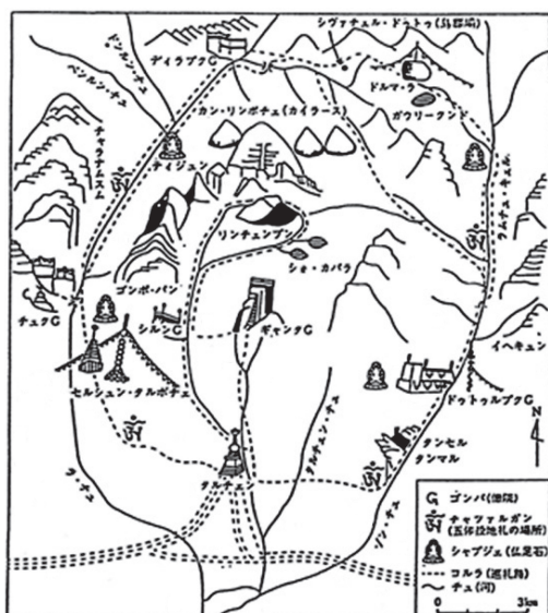
地図2 カイルース山巡礼路 (『創造の世界』86号、p.56、1993)