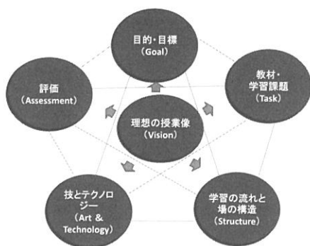
図2. 授業づくりのフレーム (筆者作成)