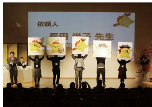
MOSTフェロー発表会「MOSTお宝鑑定団」