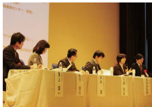
シンポジウムの様子