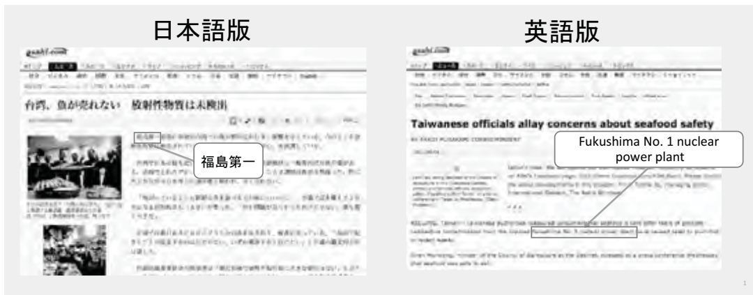
資料24-2 災害ニュース翻訳プロジェクト

う辞書連携システムを使った翻訳システムです。京都大学には専門の言葉がいろいろあるので、それを登録した辞書を作って、翻訳システムに組み込む仕組みです。「私は地域研究統合情報センターで働いています」と入れると、翻訳結果は「I'm operating on for Center for Integrated Area Studies」となりました。今回はセンターの英語名がちやんと「Center for Integrated Area Studies」と出ています。