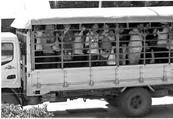
トラックで国境付近まで行き、国境の川を渡るボートで強制送還される人びと