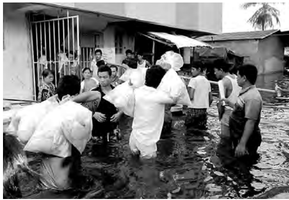
支援物資を受け取る人びと(2011年11月7日)

続いて、帰国を選んだ場合です。帰国を選んだもっとも大きな理由は「洪水が怖い」、それから「なにがどうなるかわからないから心配だ」というものです。「仕事もないし、5日も家が浸水している。この先どうなるかわからないので帰る」という話もありました。こ