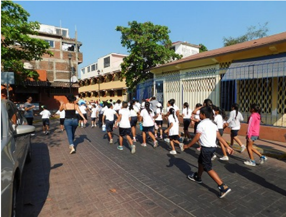
Fig.2 Tsunami evacuation drill

SATREPS プロジェクトでは、陸上と海底での地震観測 (A グループ)、地震モデリングと津波モデリング (B グループ)、脆弱性とリスク評価ならびに教育プログラムの作成と普及 (C グループ) の活動が連携して行われている。この連携を言い換えれば、A グループの観測結果を基に B グループが地震津波シミュレーションを行い、B グループの出した知見を踏まえた防災教育を C グループが行う、という関係性である。SATREPS プロジェクトは平成 27 年度から 5 年間の計画であり、平成 28 年度は本プロジェクトの 2 年目にあたる。それぞれのグループにとって 2 年目は基礎データの収集の時期の意味合いが強く、これらの連携は次年度以降に本格化する見込みである。