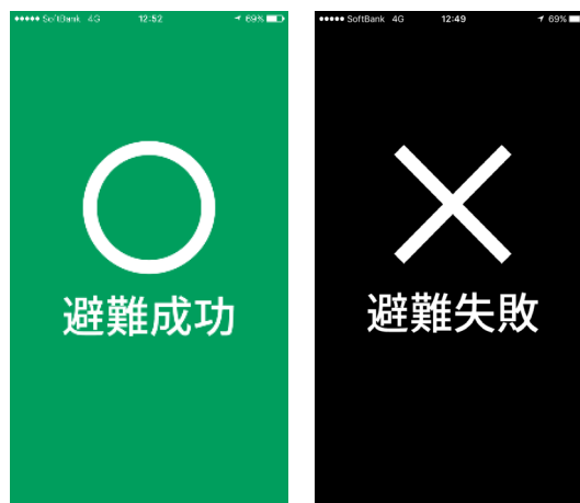
Fig.7 Screens of evacuation result