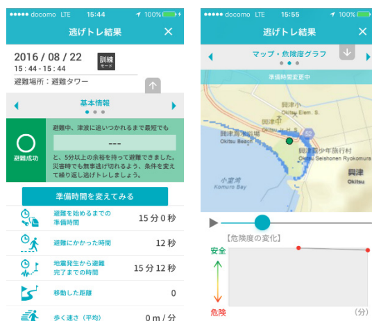
Fig.8 Screens of evacuation path record

「逃げトレ」の機能の特徴の一つは、津波リスクを明確に可視化していることである。普段津波に対して漠然としたイメージしか持っていないユーザーにとって、津波来襲状況を確認できることで、津波の切迫性を実感できるようになる。