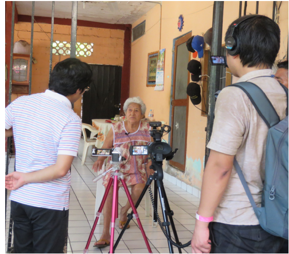
Fig.3 Interview of tsunami Experience

C グループの活動の 1 つの柱として、沿岸部の都市部について、地震・津波による構造物および地域