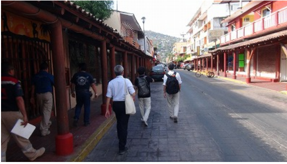
Fig.1 Fieldwork for risk evaluation