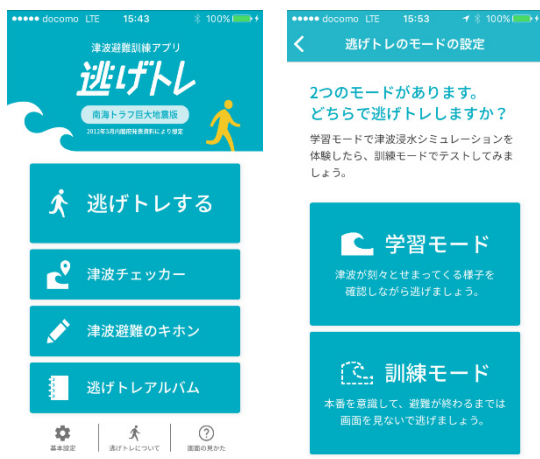
Fig.5 Screens of Nigetore Application