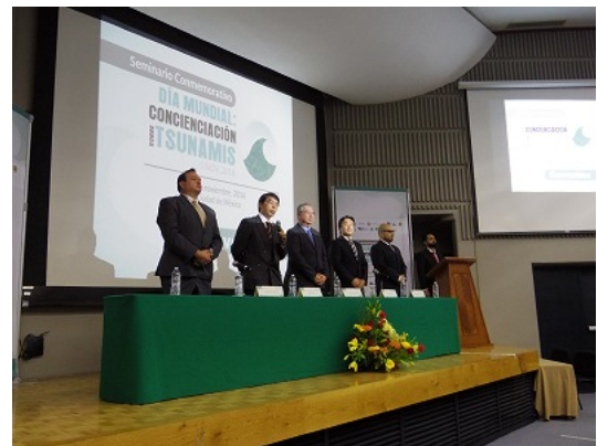
Fig.4 The event of world tsunami awareness day