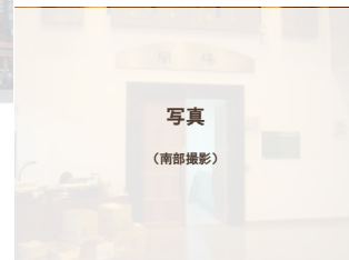
大学入試センター内