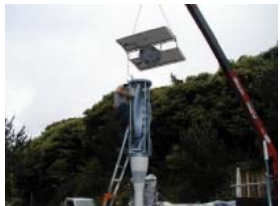
写真 4. ソーラパネル取り付け