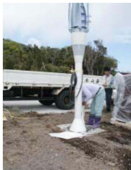
写真 5 (右). ボイドの隙間に砂を入れ、最後の深さ 30cm はコンクリートを打つ