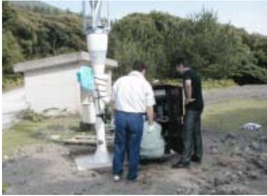
写真 6. 配線接続作業