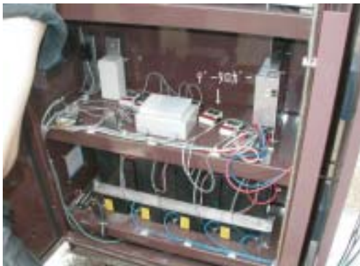
写真 7. 蓄電池収納箱内