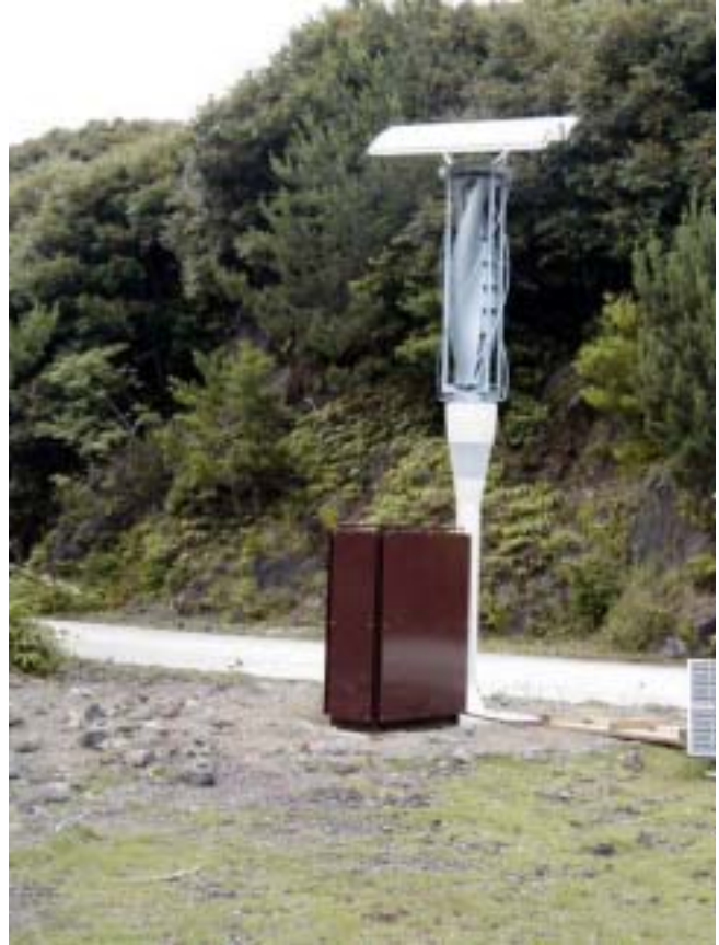
写真 8. 完 成

最後に著者の業務報告として、現場打ち合わせから設置に至るまでの経過と、最終調整・配線接続に携わってもらいお世話になった松下電器と NTT の方々を紹介する。