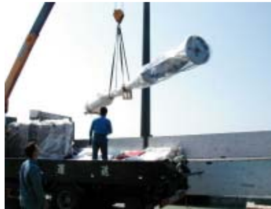
写真 1. 4/22 春日井市から鹿児島港南埠頭に到着 写真 2. フェリー屋久島 2 へ積み替え