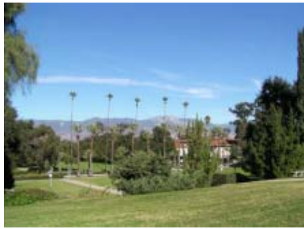
Photo.4 Redlands 大学から見たい景色