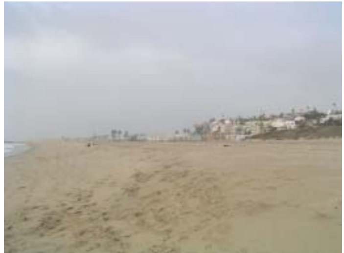
Photo. 1 ロサンゼルス西海岸

やや曇っていたせいもあり、海的美しさというよりは、砂浜の広さに圧倒されました。日本の海と比べて相対的に波は高く、風浪よりはうねりの影響が大きいように思いました。