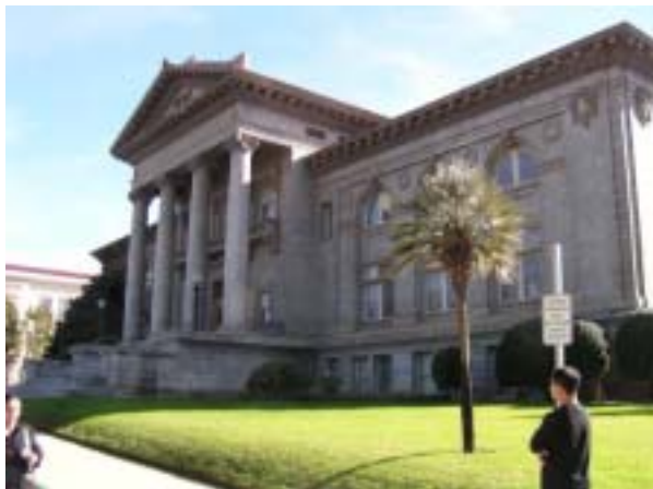
Photo.3 Redlands 大学

* ArcSDE : 空間データを DBMS に格納・管理し、供給する統合型 GIS サーバのこと。