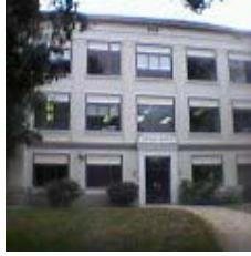
写真 2 Redlands 大学の建物

Redlands 大学では独自にスキーマやストアドプロシージャを定義し、データベースへのデータ入力、検索、表示や、 ArcSDE との連携を可能にするアプリケーションプログラムを VisualStudio.NET で作成しています。実際すでに、 XMDB は Redlands 大学内のサーバとして動いており、ほぼ問題なく動作しています。ただ、京都大学で使用するためには三つの改良を加える必要がありました。