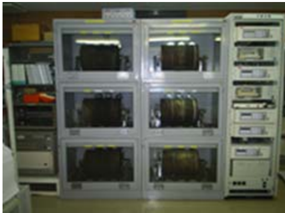
写真 2 煤書記録

雨量観測点の点検とデータ回収、雨量データの読み取りおよび整理(図 3、写真 4)、さらに森林管理署 4 への報告も行う。