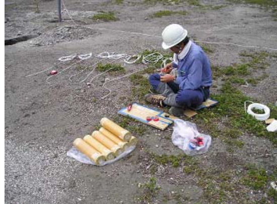
写真6 ダイナマイトの装填