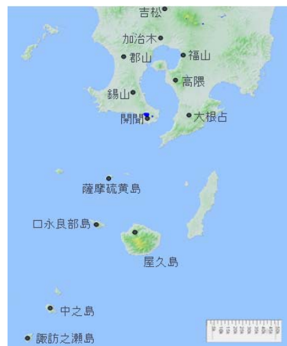
図2 広域(桜島島外)観測点