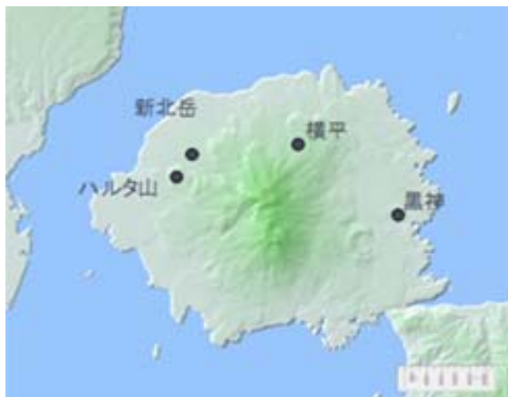
図 3 雨量観測点の位置