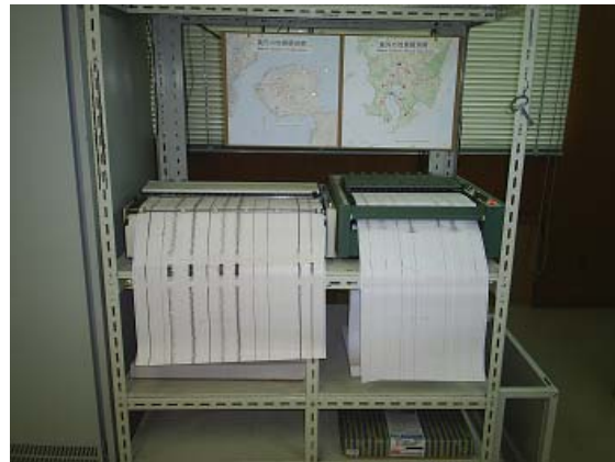
写真 3 ペンレコーダ