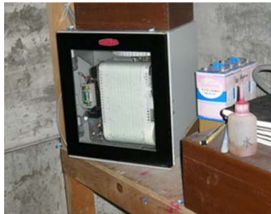
写真 4 雨量計記録紙