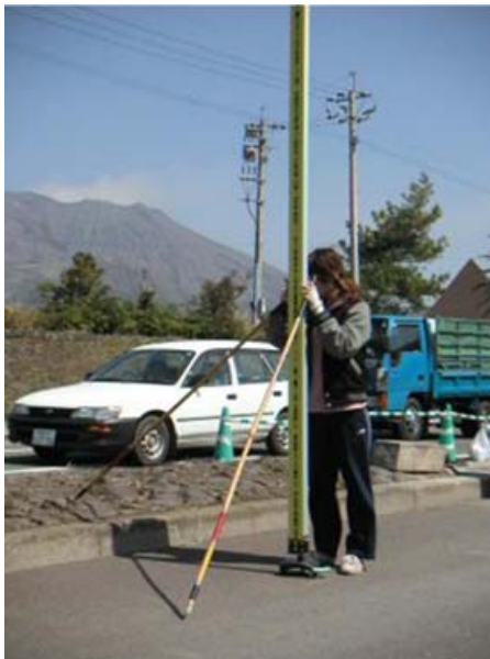
写真9 水準測量(標尺手)