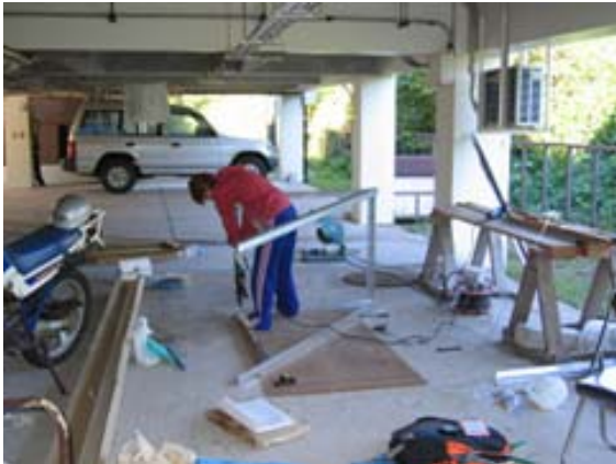
写真 11 ソーラーパネル架台製作

その他の業務としては、桜島島内と南九州および南西諸島火山に点在する 38 施設における建物等の保守管理や、火山灰除去・草刈などの環境整備、本館においては、ソーラーパネルの架台作りなどの簡単な工作(写真 11)、南岳爆発記録資料と火山灰・礫などの試料整理が挙げられる。また、鹿児島に頻繁に来襲する台風通過後の観測点見回りも大切な業務の 1 つである。倒木などにより電線などが切断された場合や、電力のブレーカーが落ちたままであると、大事なデータが伝送されなくなるからである(写真 12)。