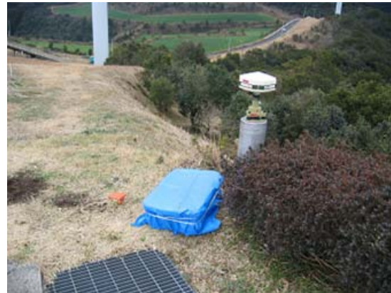
写真8 GPS 機材設置後