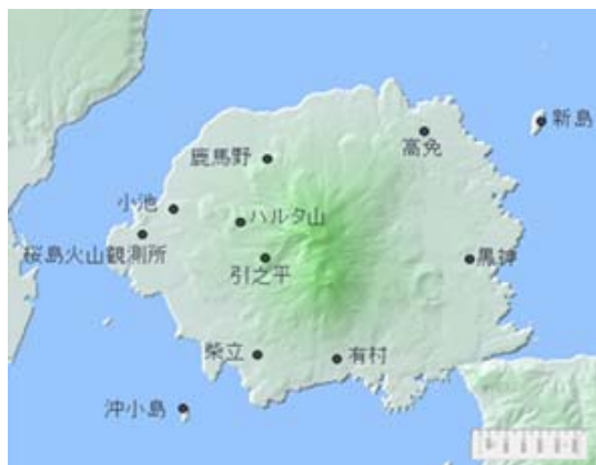
図1 中域(桜島島内)観測点