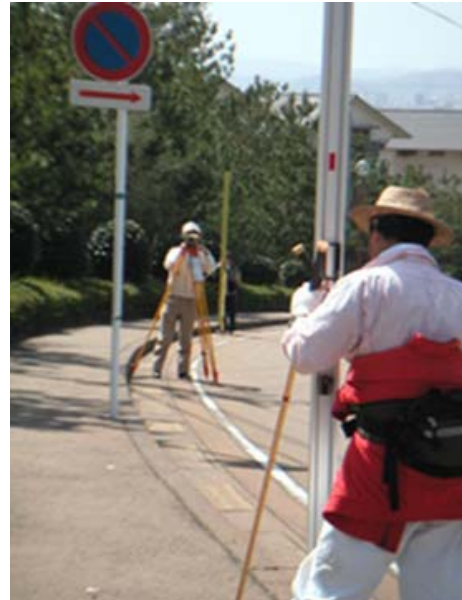
写真10 水準測量風景