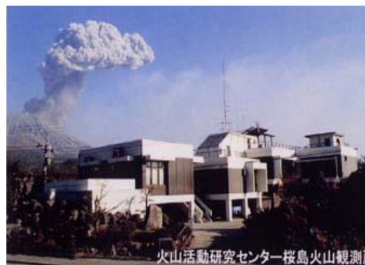
写真1 火山活動研究センター本館

火山活動研究センターでは火山噴火予知に関する研究のため、さまざまな観測・測定を行っており、そのうち、地震観測と地盤変動観測については離島を含めた鹿児島県内に観測網を配置し、連続観測を行っている(図1、2)。連続観測点のデータは、フレッツ回線(ADSL および ISDN)や無線によって、桜島火山観測所本館のテレメータ室に集約されている。