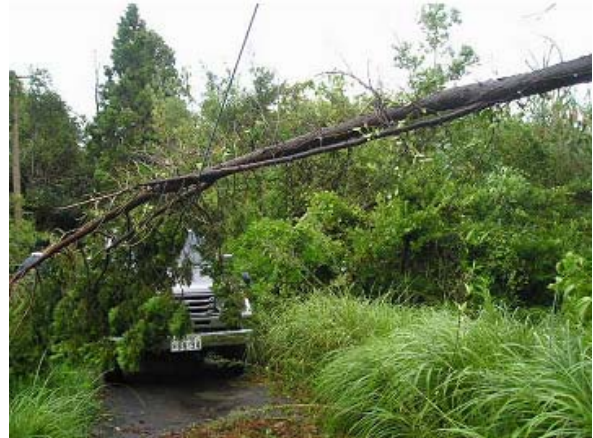
写真 12 台風直後の観測点見回り