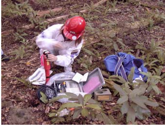
写真5 データロガー設置