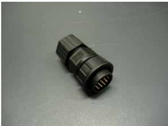
写真3 アルマナック取得用コネクタ

アルマナックとスケジュールの流し込みは、3- のLS-8200SDでは付属のコンテナに内蔵の接続機器で10台を接続し(写真4)、Assistという付属のソフトで同時に流し込むことができる。これに対して3- のLS-8000SHでは、1台ずつAssistで流し込まなければいけないため、3- のLS-8200SDのほうが、利便性が良い。