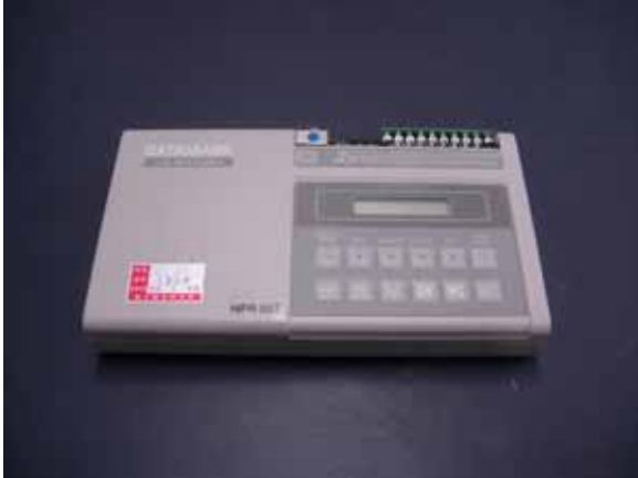
1 . LS-8000SH