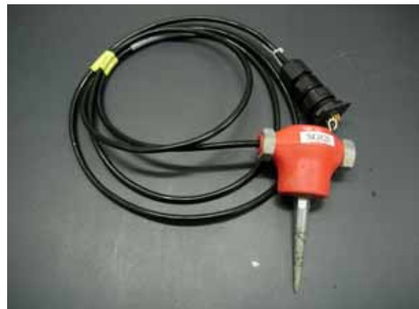
2 . SG820