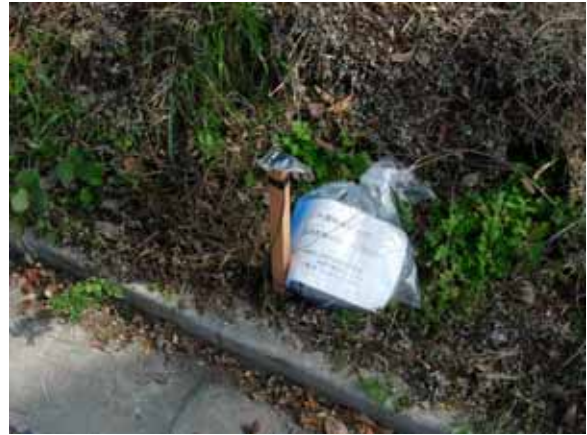
写真 5 設置された機材

ロガー電圧チェックの際、左右に電圧が表示される。右側は、外部電池の電圧、左側は内蔵電池の電圧である。左側に表示された電圧が 0V になっていることがある。この場合、LS-8000SH は経年変化のため内蔵電池が消耗しているので予備機がある場合は LS-8000SH の交換をする。予備機がない場合は、撤収の際に設定値が消えないように充電式外部電池を取り付けたまま回収にする。