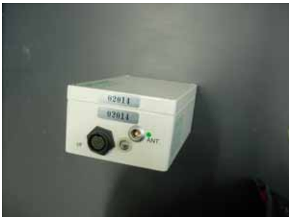
1 . LS-8200SD