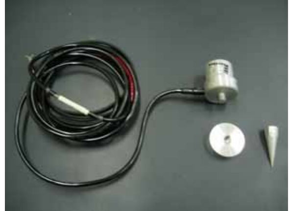
2 . L-22D