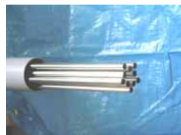
写真 3 鋼球射出装置