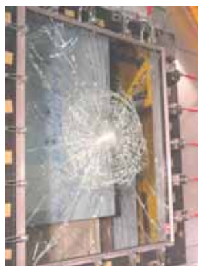
写真 4 加撃体 B の衝撃