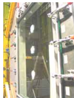
写真 5 加撃体 A の衝撃