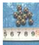
写真 2 加撃体 A