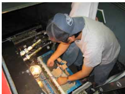
写真 4 機器接続