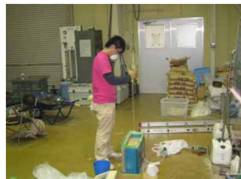
写真2 学生による実験模型製作風景

実験土槽の模型作製、メトロゾ水溶液作製と特性計測、土槽作製方法の指導などを行った。模型作製では、設計と材料加工を伴う治具の製作などを行った。「マンホールの地震時液状化による浮上対策」をテーマとする実験では、様々なテストケースに応じた実験模型の設計製作を行った。また、各実験に共通して使用するセンサー固定治具の製作も行った。実験支援においては各研究室とも基本的に週単位で使用することになっており、週毎に実験者が替わるのでその都度の対応が必要である。特にその週にトラブルがあった場合、次週以降の使用者への情報伝達は重要である。近年は使用者の数が増加傾向であるため、日単位で交代して使用することも増えてきている。