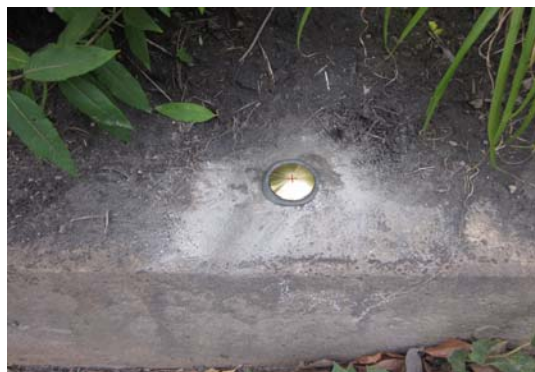
写真4 水準点設置完了