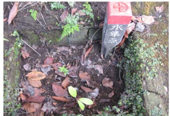
写真8 S26 1957年設置