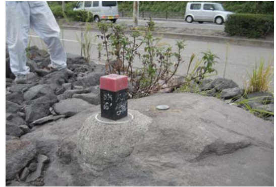
写真6 様々な標柱写真②