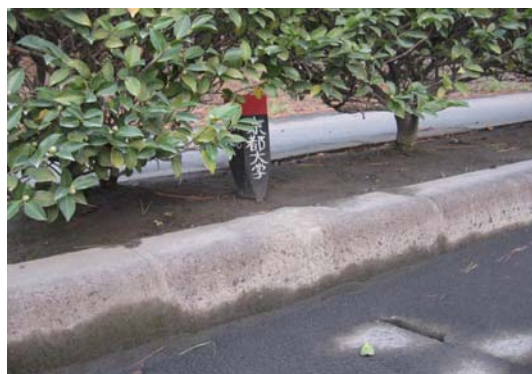
写真5 様々な標柱写真①