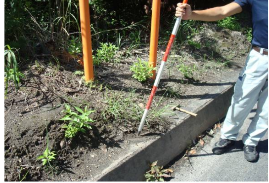
写真 2 設置許可申請用写真