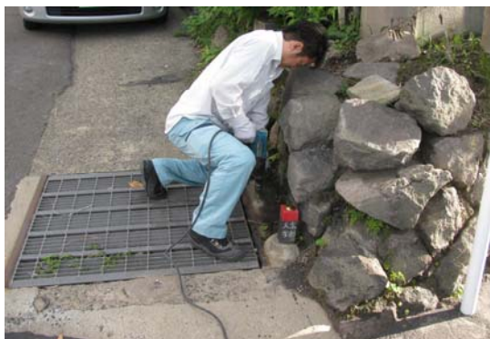
写真3 水準点設置作業