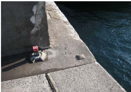
写真7 S17 1957年設置

水準点は設置後、特別の事由が無い限り、ほぼ半永久的に使用する。桜島では、約半世紀に涉って使用され続けている水準点もある（写真7、8）。繰り返し行われている観測のなかで、水準点はなくてはならない大切なものであり、今まで諸先生方、先輩技術職員のご尽力により大切に守られてきた。この水準点を、今後も守りつづけていくよう努力していきたい。