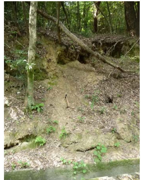
写真2 強風化して崩壊している丹波層群

調査ボーリングより想定される想定地質断面図を図1に示す。同図より、崩壊箇所では当初想定とおり盛土（埋め土）が施工されており、N値3回以下と非常に緩いものであった。盛土は、粘性土を主体としており、内部に木片等を含む。盛土の下位には層厚3m程度の崖錘堆積物が分布しており、N値は6～11回と粘性土としては比較