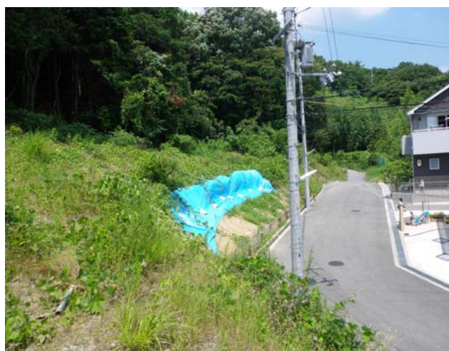
写真 1 崩壊斜面の状況

写真にあるように、当該斜面前方には民家が写っているが、これはここ 3 年ほどの間に行われた造成によるものである。造成前の測量図面を見ると、当該斜面には小規模な沢地形が認められるが、造成後はその沢地形がなくなっており、造成時に埋められたものとみられる。このため、降雨時に地下水位が上昇し、間隙水圧の増加による有効応力の低下が発生し、斜面崩壊が発生したものと推定された。また後述するボーリング結果によると、埋め戻しに使われた材料は現場発生土で、その締め固めが十分行われていないものと推定された。