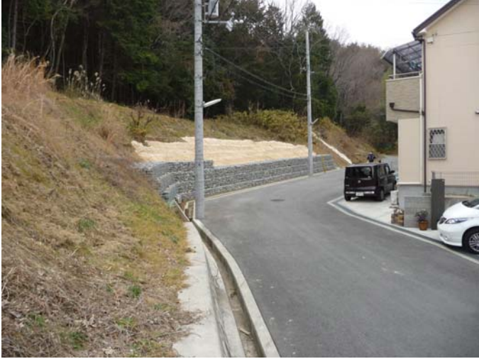
写真3 対策工完了状況

今回、阿武山観測所で発生した小規模斜面崩壊は、発生当初は自然斜面の崩壊であるとみられたが、実際に調査を行ってみると宅地造成時の地形改変がその主因であることが明らかとなった。