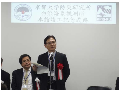
式辞 湊理事・副学長