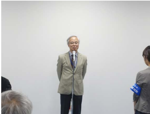
挨拶 大志万研究連携基盤長