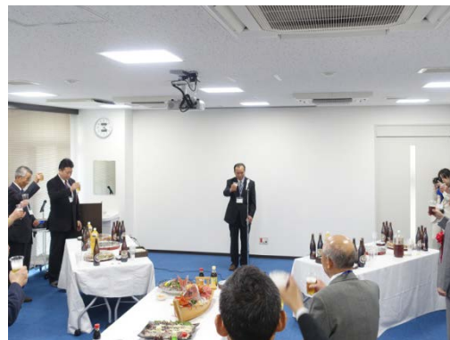
乾杯挨拶 巽理事長