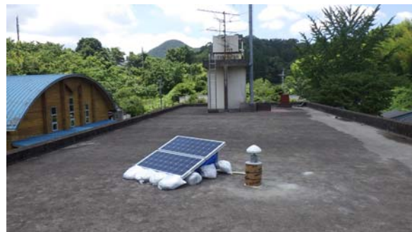
図 3 設置完了例