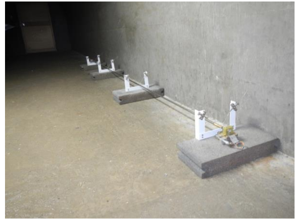
図4 製作した伸縮計の模型

次に、模型の設置場所である。伸縮計などの観測機 器は、坑道の入口から約100 m先に設置している。 観測機器を設置している場所までは複数の扉があり、 扉によってスペースが仕切られている。そのため、観 測機器の設置場所よりも入口に近いスペースで、かつ、 観測データに影響のない場所に模型を設置すること にした。また、坑道内は暗いため、照明付近に設置し、 通行の邪魔にならないよう、端によせることにした。