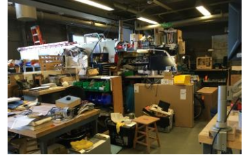
pic.7 The Exploratoriumの工房

The Exploratoriumの仕組みで特に面白いと感じたのは、展示物の考案・作成・修理のすべてがThe Exploratoriumの中にある工房内で行われているということである。つまり、デザイナーは体験するユーザーを実際に見ながら、次に何を作るか、ある原理の面白さを伝えるためにはどのような展示物を作ったら良いのか、考えるのである (pic.7)。