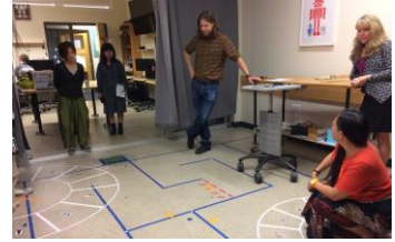
pic.2 プロジェクトのデモの様子

ATLAS Institute（以下、ATLAS）内の見学とATLASで行われている研究プロジェクトを紹介していただいた（pic.2）。またATLASの先生や学生たちに向けてPechaKucha styleによる自身の研究内容の紹介を行った。2日目には、工作実習授業に参加した後、電子部品の製造・販売を行うSparkFunの工場見学に行った。