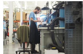
pic.4 スタッフが制作している様子

2日目に訪れたSparkFunでは、様々な電子部品が作られる様子を正に目の前で見学することができるようになっており、工場見学でよくあるような、柵やガラス窓はない。スタッフが細かな電子部品を制作する様子や基盤を焼く機械を間近で見ることができる（pic.4, 5）。またスタッフは工場内に飼い犬を連れてくることができるようになっており、広い工場内をスケボーで移動するスタッフの横を愛犬が付いてまわるといった光景も見られた。日本では、有名IT企業の自由なオフィスがときどき地上波で流されるが、さすがにここまでの自由さを見たことがない。そして、ここでは単なるもののデザインでなく、オープンな場の中でスタッフ同士がうまくコミュニケーションを取りながら、作り上げていく「デザイン」の場ができていていると感じた。