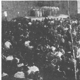
合唱団の発表練習の様子

時ならぬ賑はひをみせた 合唱團の発表練習 本校の合唱団は、最近の発表練習で大入りした。これは、合唱団員たちの熱意と指揮者の巧みさの結果である。練習は、観客から大きな拍手と称讃を受けた。合唱団は、今後もより高いレベルでの発表を目指している。