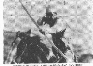
夜陣の軍(下) 砲臺(右) 砲臺(左)

木下青陽がくは、その表現の自由と、その表現の力に、他のどの藝術よりも優れている。それは、その表現の自由が、その表現の力に、他のどの藝術よりも優れている。それは、その表現の自由が、その表現の力に、他のどの藝術よりも優れている。 木下青陽がくは、その表現の自由と、その表現の力に、他のどの藝術よりも優れている。それは、その表現の自由が、その表現の力に、他のどの藝術よりも優れている。それは、その表現の自由が、その表現の力に、他のどの藝術よりも優れている。