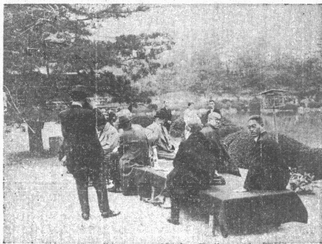
會遊園大のブラク大京

スキー部は、この冬、志賀高原熊の湯に合宿した。スキー部は、この冬、志賀高原熊の湯に合宿した。